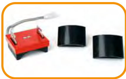
Abb. 1 · Kappenset

JETZT NEU! 'Girly' T-Shirt Austausch- Druckplatte