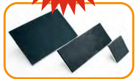
Abb. 3 · Druckplatten in verschiedenen Größen