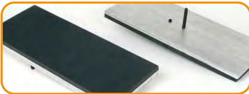
Abb. 2 · Hosen- oder Ärmel-Druckplatte