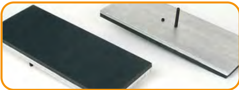
Abb. 2 · Hosen- oder Ärmel-Druckplatte